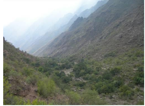
”أحذر من النمر“ - وادي يعر جبل ملحان ارتفاعه 2800 متر فوق سطح البحر هانس والأصدقاء قرب عسوط

5. إعلان جبل ملحان محمية طبيعية: بعد عودة دولة الدكتور علي محمد مجور، رئيس الوزراء اليمني ومعالي الوزير عبدالرحمن الإرياني، عضو مجلس المؤسسة، من مؤتمر ناجويا للتنوع الحيوي، قادا مجلس الوزراء اليمني لإعلان جبل ملحان محمية طبيعية في يوم 24 نوفمبر. وفي حين ما زال هناك الكثير من العمل لضمان التطور السليم لهذه المحمية، فإن الإعلان قد وجه رسالة قوية لسكان جبل ملحان بأن أحد عوامل ازدهار المنطقة هو المحافظة على التنوع الحيوي لهذه البقعة الجميلة من محافظة المحويت.