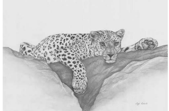
"نمر مواجه" - 23 شبر عرض x 14 شبر طول

3) النسخة الرقمية لإستراتيجية حماية النمر العربي في الجزيرة العربية أصبحت الآن متاحة :