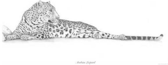
"نمر كامل الطول" - 23 شبر طول x 43 شبر عرض