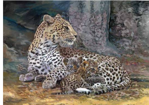
شكل رقم 1 صورة من كتاب البقع المتلاشية